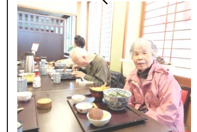
かごの屋に行きました♪

外食にかごの屋へ行きました♪ お出掛け前から、『何食べようかな』ソワソワ楽しみにしながら…メニュー表を見て、『これ美味しそうやわ…』『いやいやこっちもいいねえ…』と色々悩み選んだ一品は…特別美味しかったようで…あっという間に完食♪『美味しかったあ』と笑顔♪また行きましょね♪