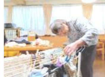
朝の日課♪タオル干し★

毎朝、タオルの洗濯が仕上がる と、手の空いている利用者様のご協力で、タオル干しをしてくださいます。シワを伸ばしながら、ひとつずつ丁寧に… テキパキとあっという間に… 『出来たよ〜』と。いつもたくさんお手伝い助かっています♪