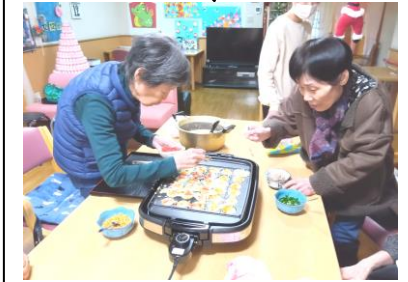
みんなでたこ焼きパーティ♪

ある日の昼ご飯、たこ焼きをしました♪みんなで順番を考えながら、具材を入れて…『タコ先やで！』『次、天かすは入れるで！』『まだ触ったらあかんで！』『もうひっくり返すで！』と…さすがの大阪のご婦人たちはまんまるたこ焼きを作ってくださいました♪