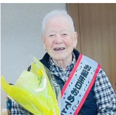
Y様 歌声が素敵です♪