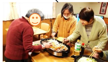
みんなで協力♪焼きそば作り

調理の日♪ホットプレートを使って、みんなで焼きそば作りをしました☆『油引いて…野菜やったな』『炒めようか、肉も焼かなあかん』主婦たちは相談しながら、着々と美味しい焼きそば作り♪味ですか?みんなで作った焼きそば、ほんと美味しかったです♪