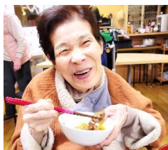
M様 お肉大好きです♪