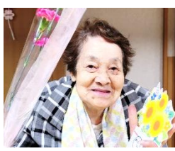
K様 プリンが大好きです♪