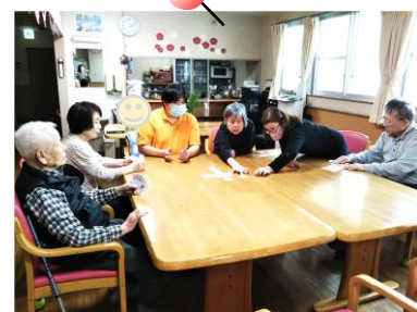
元旦♪七並べしました〜!

お正月♪フロアーでは七並べを開催♪『どんなんやったかな…』とルールを確認しながら、みんなで考え、楽しむ時間♪『どれだ出すの?』『これじゃない?』相談しながら…♪勝負の行方は…果たして…のんびりなお正月でした☆