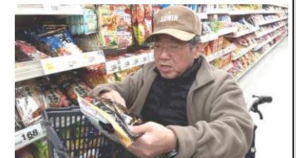
美味しいお菓子選び中♪

天気がいい日♪近くのスーパーにお買い物に出掛けました♪美味しそうなお菓子がたくさん並んでる中…『これがいいな…あれもいいな…』と時間をかけて物色中♪甘いクッキーやチョコレート♪魅力いっぱいな場所☆幸せ一杯な時間になりました!