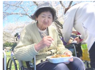
お花見に行ってきました♪