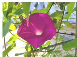
朝顔が咲いています♪

暑さも和らぎ、過ごしやすい気候になってきましたが、コロナウィルスの猛威はなかなかおさまらず、ホーム内で楽しんでいただけるような工夫をしながら過ごしています♪