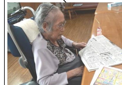
良いニュース・・・

密かに人気のヤクルト。1階のヤクルトレディによる配達を楽しみにしています♪ 朝は同じように気になる朝刊! ヤクルト片手に真剣に読破! 何か良いニュースはありましたか? 順番待ちをしながら新聞と広告を観るのが日課です。「広告の品!」早く自分達で見に行きたい…。