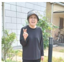
S 様 テキパキ何でも出来る 優しい女性です♪