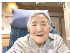
T 様 笑顔が素敵な女性です♪