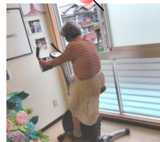
エアロバイクでダイエット