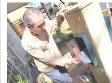
新聞は僕の仕事です。

身体を動かすことがとっても好きなこの方は、ある日やってきたエアロバイクを見て、とっても喜ばれ♪食後に運動、時間ができた時に…気が付けば、自転車をこいでいる姿を見かけます♪『あなたもしたいのに…』と職員に…尊敬のまなざしで見守っております♪