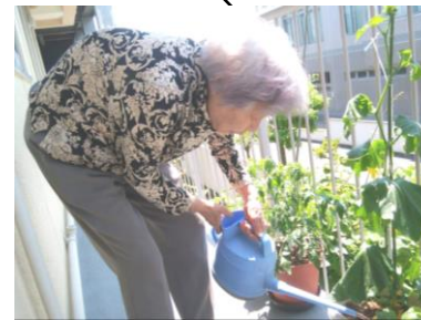
すくすく大きくなーれ♪

今日の昼食は…手作りハンバーグ♪いつもと違う、ナイフとフォークを使い、洋食スタイルでの食事してみました。皆様、久々の感じに最初は迷いながら…慣れてこられると、とても上品に食事が始まり…しばらくするとナイフは置いたままに…(笑)