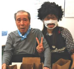
たい焼き屋さんが開店♪

今日の昼食は…手作りハンバーグ♪いつもと違う、ナイフとフォークを使い、洋食スタイルでの食事してみました。皆様、久々の感じに最初は迷いながら…慣れてこられると、とても上品に食事が始まり…しばらくするとナイフは置いたままに…(笑)