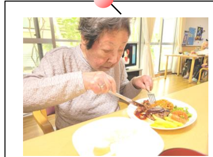
洋食スタイルでの食事♪

2階のベランダでも、きゅうりを育てております。毎日、窓の外を確認し、『水やらなあかな…』と成長を楽しみにしながら大切に育ててくださっています♪おかげさまで、先日、花が咲き、きゅうりが無事収穫できました美味しいお味が楽しみです☆