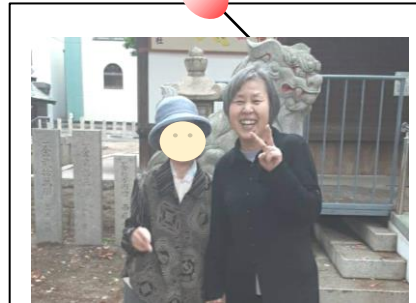
神社まで散歩に来ました♪

近くの神社まで気分転換に出掛けました♪世間話をしながら、少しづつ、しっかり歩きながら…♪大きな大きなくすの木を見ながら、木陰に吹き抜ける風に…『気持ちいいね♪』と自然な笑顔でのこの一枚。昔話をしながら、楽しく過ごす貴重な時間♪『また行きましょね〜♪』