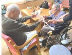
いつもありがとう♪