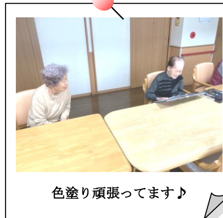
色塗り頑張ってます♪

ある日のお茶の時間、「そんな難しい本を読んでるのすごいな!」「いやいや、そんな大したことないよ!」「いや!大したもんよ」「うふふ(笑)」と、いつもこんな感じでお茶を片手に皆で話をしながら楽しまれ、和やかな雰囲気癒されております☆