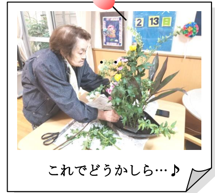
これでどうかしら…♪

毎月、玄関に生け花をお願いしています。『これはここのほうがいいな』『もうちょっと短めのした方がいいか…』と、長さや配置を見ながら、色々試行錯誤しながら生けてくださいます♪『綺麗やわ…』と自身で自画自賛しつつ(笑)来月もよろしくお願ひします。