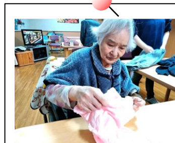
食事タオルは私が…

洗濯物が仕上がると皆で一斉に洗濯たみが始まる午後のひと時♪ いつも食事の時に使うタオルをたたんでくださっています。 あーでもない！こーでもない！と言いながら、みんなで笑い合いながら楽しくお手伝いして下さいます。 職員より上手で丁寧です(笑)さすが長年されていたカリスマ主婦♪