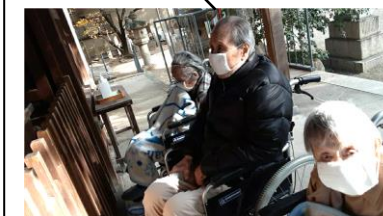
華表神社まで散歩に♪

『お外の空気は気持ちいいね…』 『でも寒いよ…』と楽しそうな会話をしている間に、華表神社の前では手を合わせ…皆さんは何を願っているのでしょうか…『みなさんが元気で過ごせますように♪』