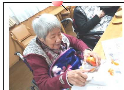
柿のジャム作ってます♪

近隣の方から柿をたくさんいただいたので…干し柿の時と同様に利用者様に剥いていただき、ジャムにすることにしました☆ 手慣れた手つきで手伝って頂き♪できたジャムは食パンに付けたり、ヨーグルトに入れたり美味しくいただきました♪