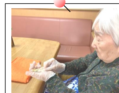
餃子なら私に任せて♪

皆で餃子作りを楽しみました☆最初は皆さん「こんなん、私できるかな。」「初めてするけどええか？」等不安そうにしてましたが、実際やってみると綺麗に作って下さり「出来ることはするから言うてな！」と心強いお言葉！！皆で作った餃子は絶品でした♪